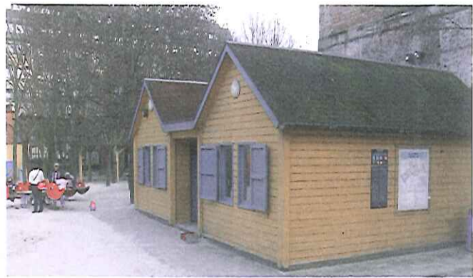
Parc de Liedekerkepark